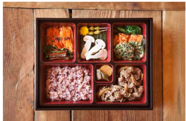
Fig. 3. Composition of lunch box.

착용해 종가라는 이미지를 강조했다. 음식관광해설사의 복장도 한복을 활용한 의상과 전통 매듭 노리개 등으로 전통요소를 연출함으로써 무형의 자원인 사람도 관광자원으로서 역할을 했다. Fig. 4와 같다.