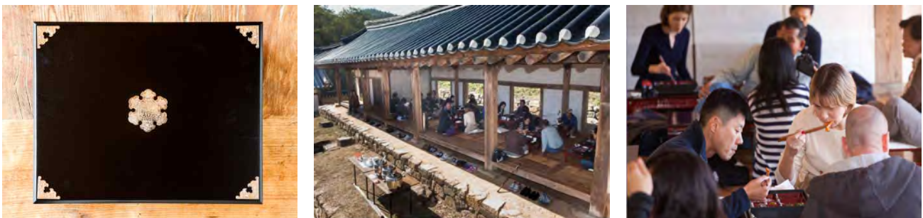
Fig. 2. Lunch box container and participants seat arrangement.

식사 후 ‘종손으로부터 효(孝) 사상과 종가문화 배우기’, ‘고임음식 체험하기’, ‘마을 전통식품 오색한과 체험하기’, ‘달실마을 골목길 투어’, ‘층재 고택 투어’, ‘청암정 투어’ 등의 프로그램을 마련하여 재미있게 종가문화를 체험하도록