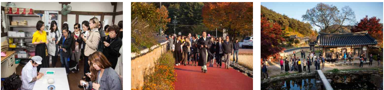
Fig. 6. Dalsil village alley, Hangwha experience center, Cungamjung tour.