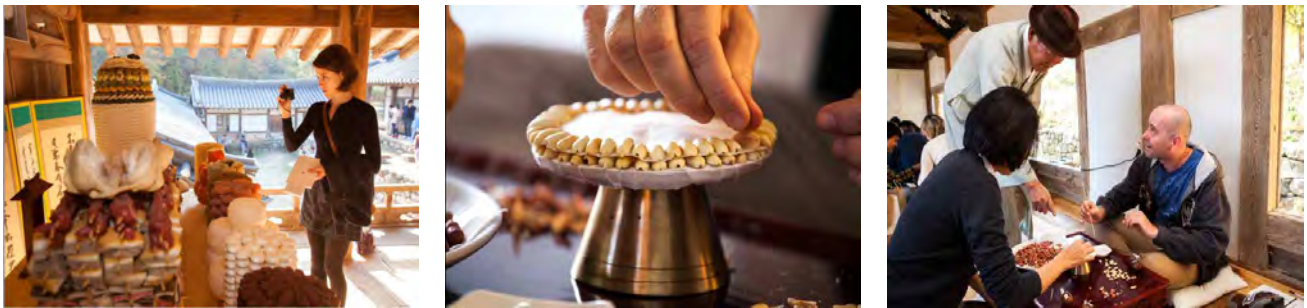
Fig. 5. Jongga culture and Goin food experience.

Yang IS 등(2004)은 한국전통음식 관련 관광상품에 대해 언어권별로 선호하는 유형에 차이를 보인다고 하였으며, Zhang ZY 등(2014)은 한·중 대학(원)생은 음식관광지 선택속성 품